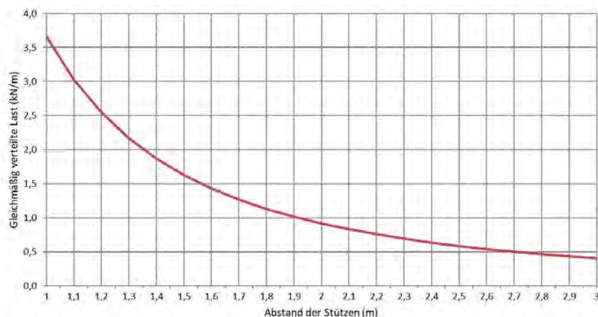
Zulässige Belastung KP 60/200 d=0,8mm (kN/m)